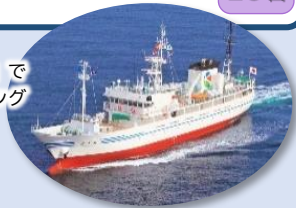
「翔洋丸」でクルージング