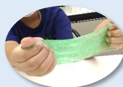
スライム名人になろう