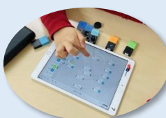
MESHでプログラミング