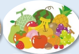
果物の香りは何の香り