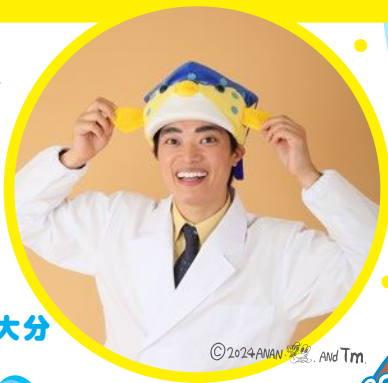
©2024 ANAN 登録商標 And Tm.