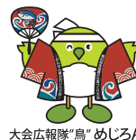
大会広報隊「鳥」めじろん

・来場者駐車場はありませんので公共交通機関をご利用ください。・飲食ブースでは、紙等のプラスチック代替容器で食品をご提供します。会場内でのごみの分別にご協力ください。